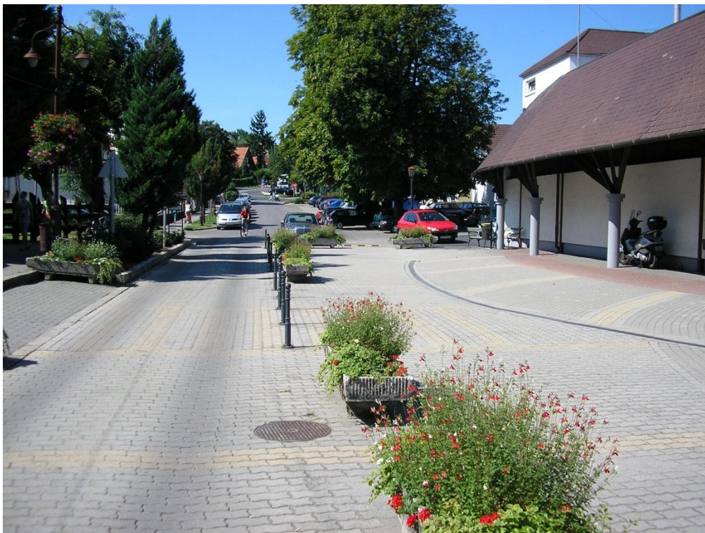
Hunyadi J. u. áruház mögötti térburkolat