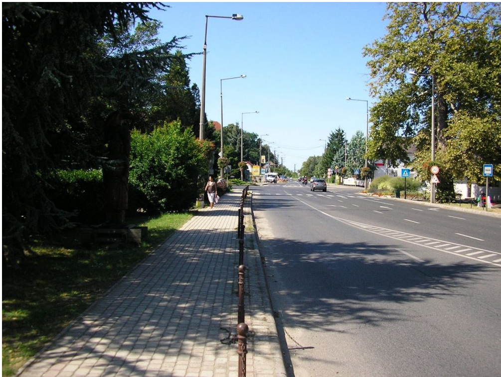
7 sz. főút bal oldal