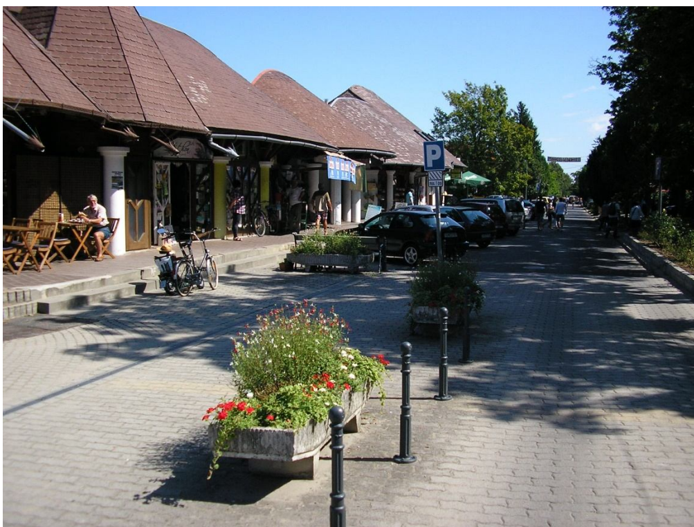
Hunyadi J. u. áruház mögötti térburkolat