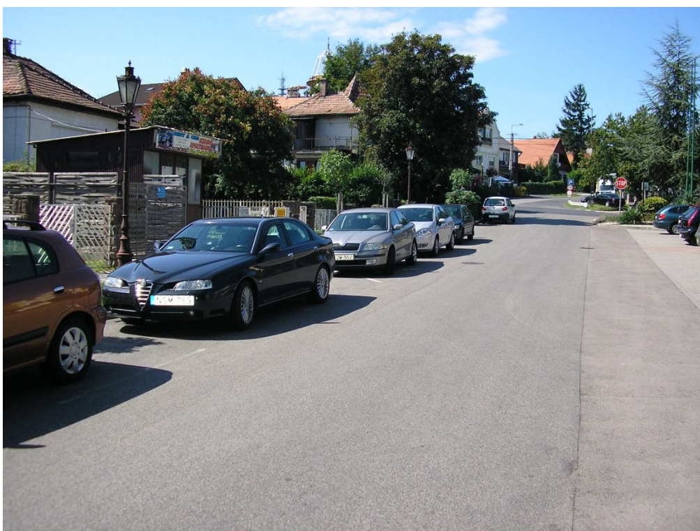
Hunyadi J. u. (Szent István u. - Hegyalja u. közötti szakasz)