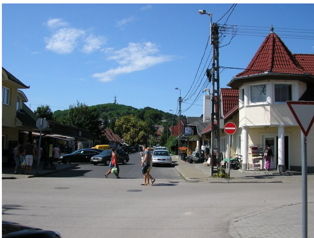
Béke u. - Blaha L. u. csomópont egyirányú útszakasz vége