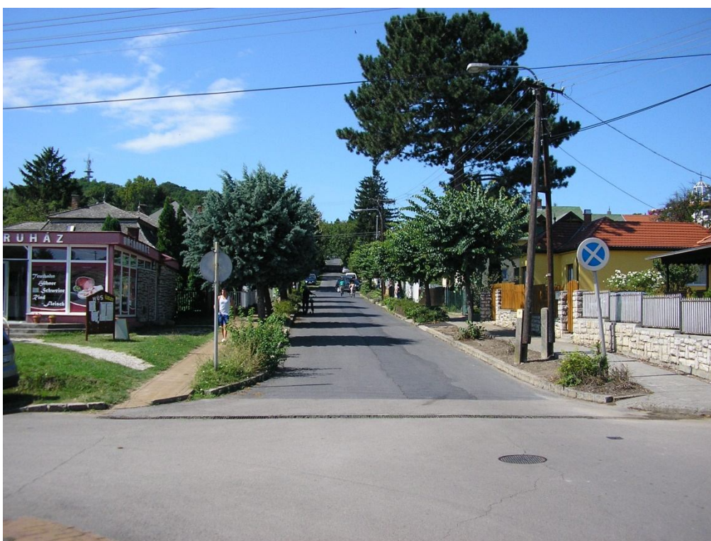
Karácsony S. u. - Hegyalja u. csomópont