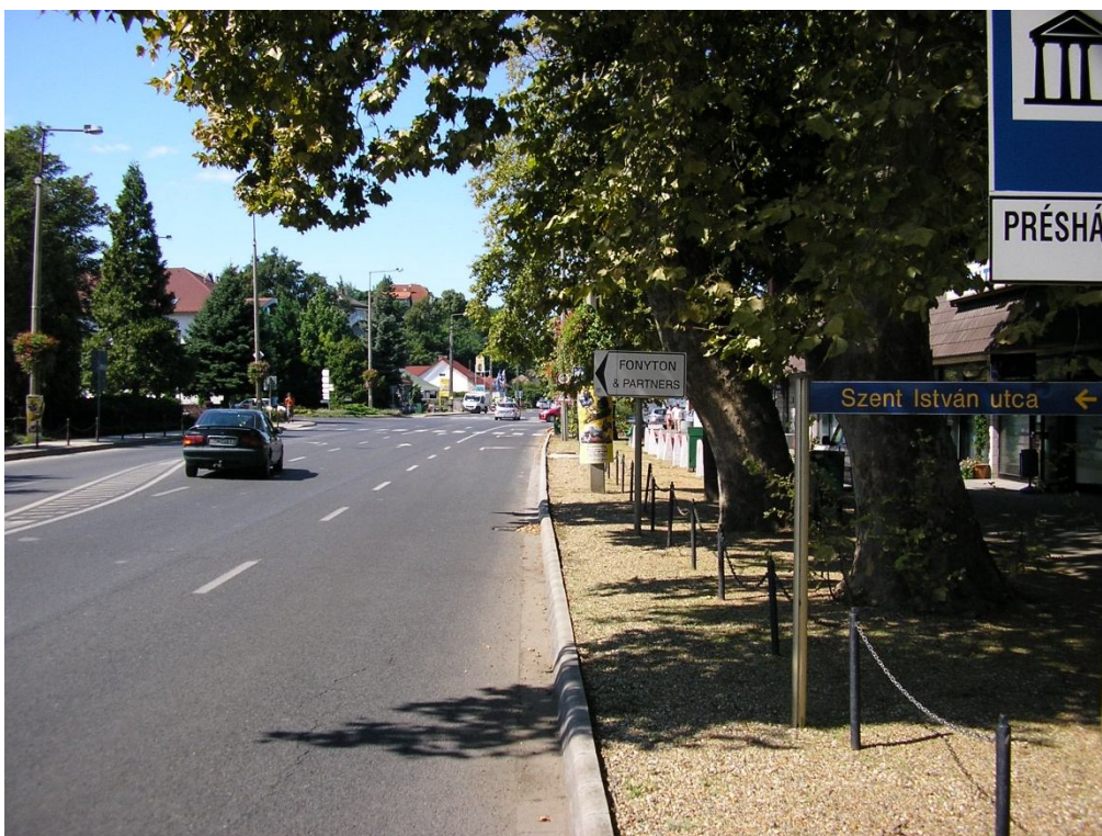
7 sz. főút jobb oldal