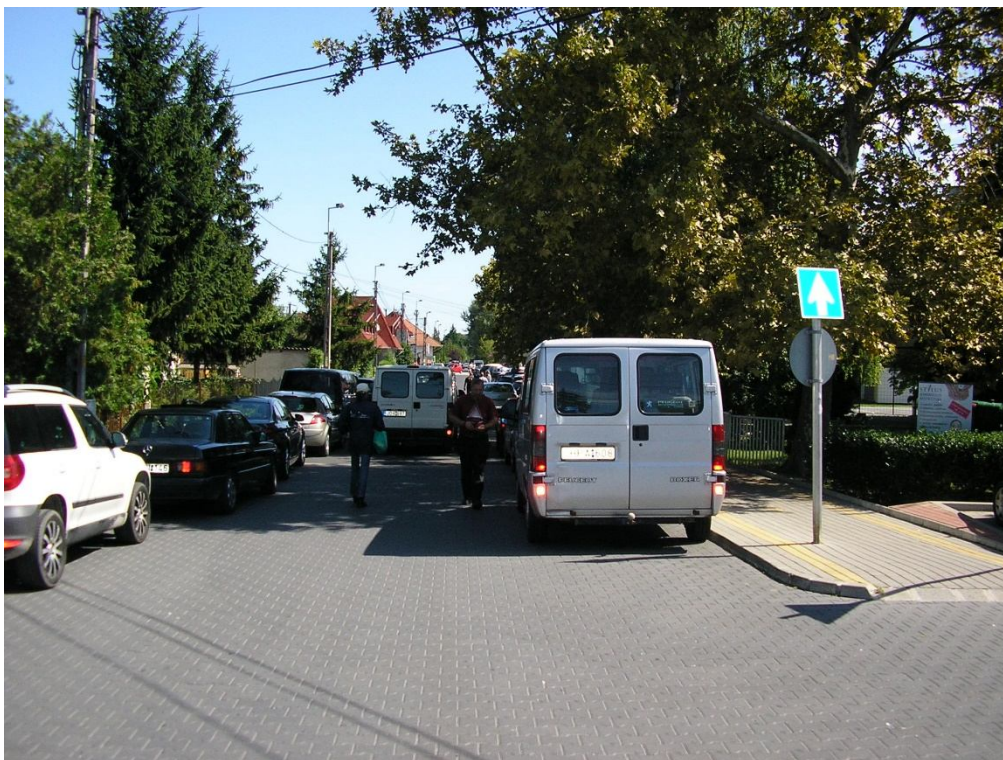
Béke u. egyirányú útszakasz kezdete