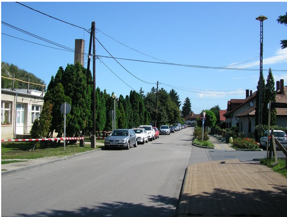
Karácsony S. u. - Szivárvány u. csomópont