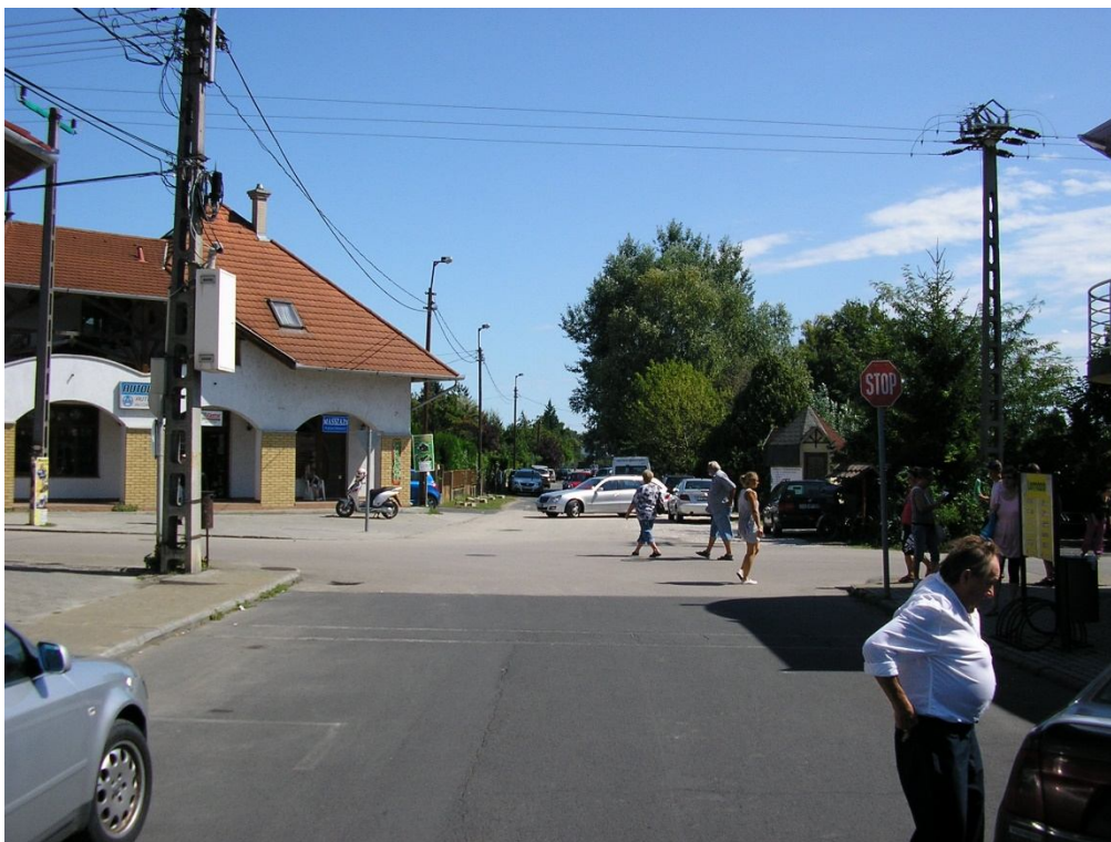
Béke u. - Blaha L. u. csomópont