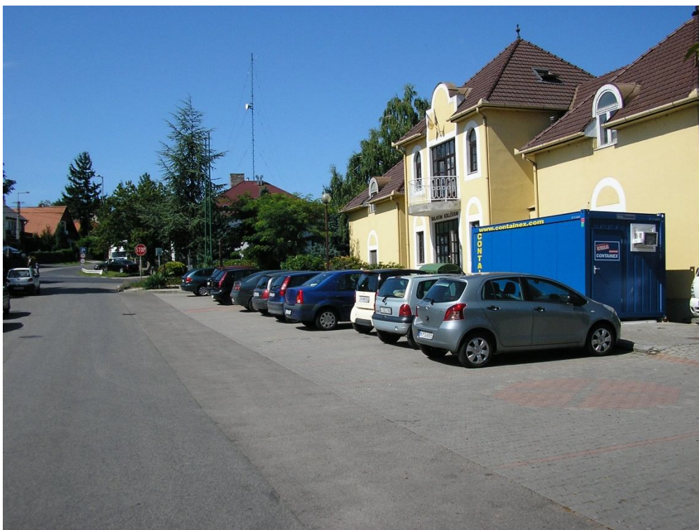
Hunyadi J. u. kollégium előtti parkolók