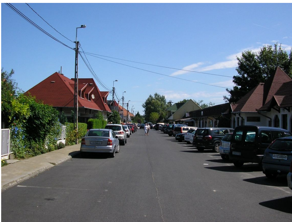
Béke u. középső szakasz várakozóhelyek