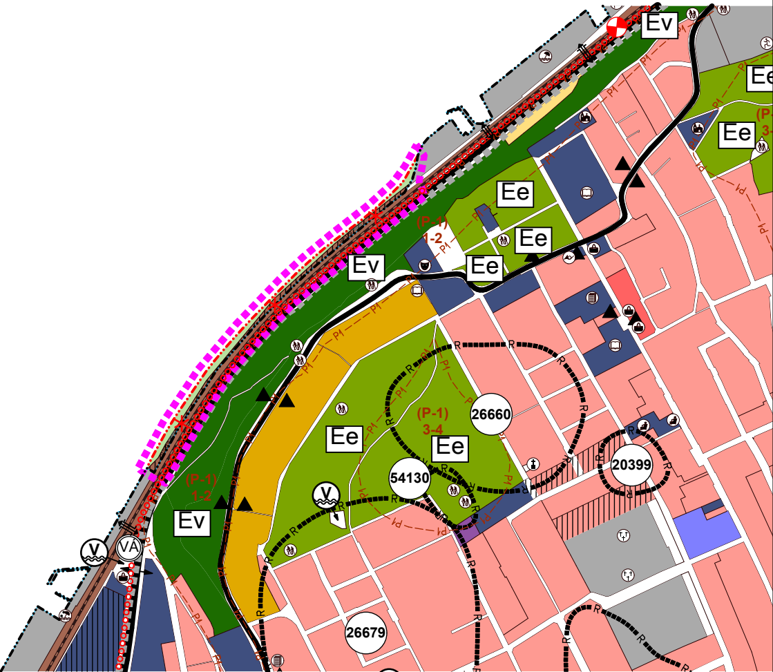
MÓDOSÍTOTT SZERKEZETI TERV KIVONAT A 02/119 HRSZ-Ü INGATLANRA VONATKOZÓAN

MÓDOSÍTOTT TELEPÜLÉSSZERKEZETI TERV KIVONAT A 8261, 8199, 8243/10, 7261, 8243/11, 8243/12 ÉS A 02/119 HRSZ-Ü INGATLANOKRA VONATKOZÓAN