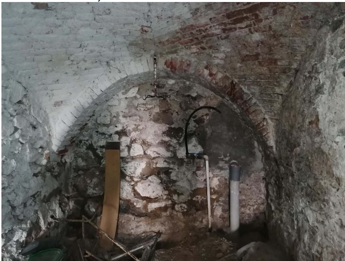
Fotódokumentáció: Fonyód 2022.03.16