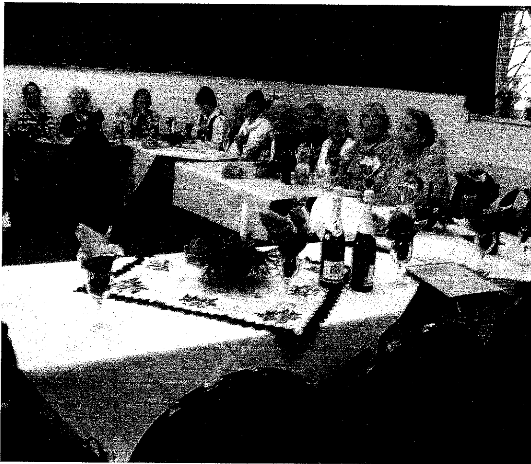
Pillanatkép a karácsonyi ünnepről.

Örömmel írhatom, hogy a z előre megtervezett céljainkat sikerült az idén is megvalósítani.