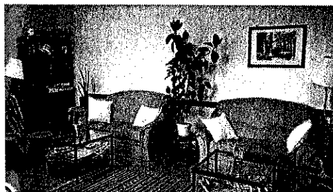
A Gondozási Központ ellátási területén nyújtott szolgáltatások