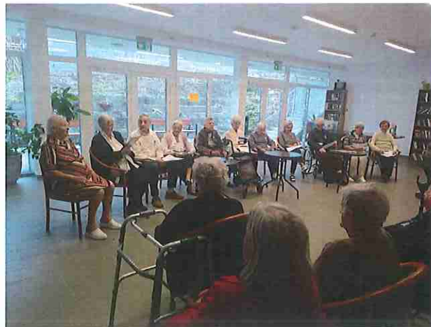
Március 15-i ünnepség

Március 15-én megemlékezést tartottunk az 1848-as forradalom és szabadságharcról. Lakóink versekkel, dalokkal készültek a többi ellátott számára.