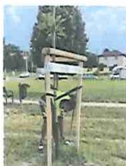
Kis fa gyomlálása

Külön figyelmet szenteltünk a városban az elmúlt években elültetett fiatal fák gondozásának (koronaalakítás, tányérozás, öntözés, támoszlop igazítás stb.), de a korábban ültetett fák fenntartásának is. Elvégeztük a gesztenyefák tavaszi permetezését valamint kártevők által megtámadott fák kezelését is.