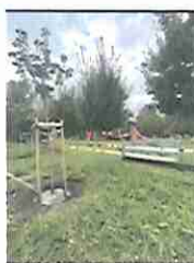
Kis fa öntözése

Tél végén, kora tavasszal, zömmel még lombfakadás előtt intézmények udvarán is elvégeztük a szükséges faápolási munkákat: ifjítottunk, szárazgallyaztunk, a kiszáradt, veszélyes fákat pedig kivágtuk.