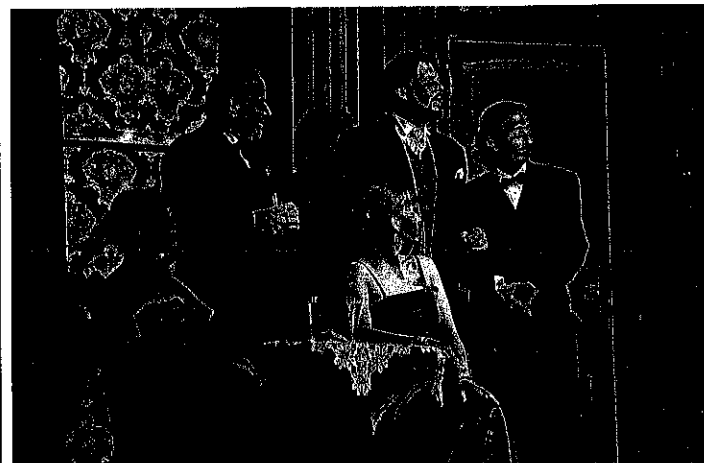
Fotók „A Muzsika hangja” című darabból (2011 - 2014)