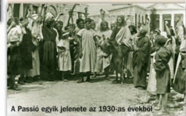
A Passió egyik jelenete az 1930-as évekből

Passionsspiele auf dem Steinberg – Von 1933 bis 1939 wurden auf dem Steinberg deutschsprachige und ungarische Theatervorführungen über den Leidensweg und der Kreuzigung Christi gezeigt, wobei etwa 200 Ortseinwohner mitwirkten. Die Kulisse wurde von der Gemeinde gemeinsam erbaut, sie war 70 Meter lang und 20 Meter breit, und es gab 2000 Sitzplätze für die Zuschauer. 1939 sind die Vorführungen wegen dem schlechten Wetter und wegen Geldmangel eingestellt worden. Nach der Vertreibung sind die Kulissen der Passionsspiele abgerissen und das Baumaterial weggetragen worden. 1996 hat man die Passionsspiele erneuert und ab 2000 werden sie alle drei Jahre wieder auf dem Steinberg veranstaltet. Organisator ist die Deutsche Selbstverwaltung Wudersch, finanziell getragen wird es von der Stadtverwaltung Budaörs.