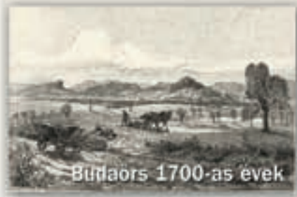
Budaörs 1700-as évek