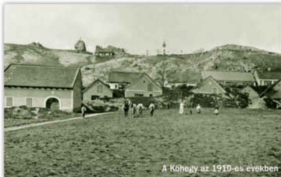
A Kőhegy az 1910-es években