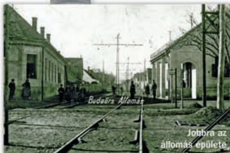
Jobbra az állomás épülete