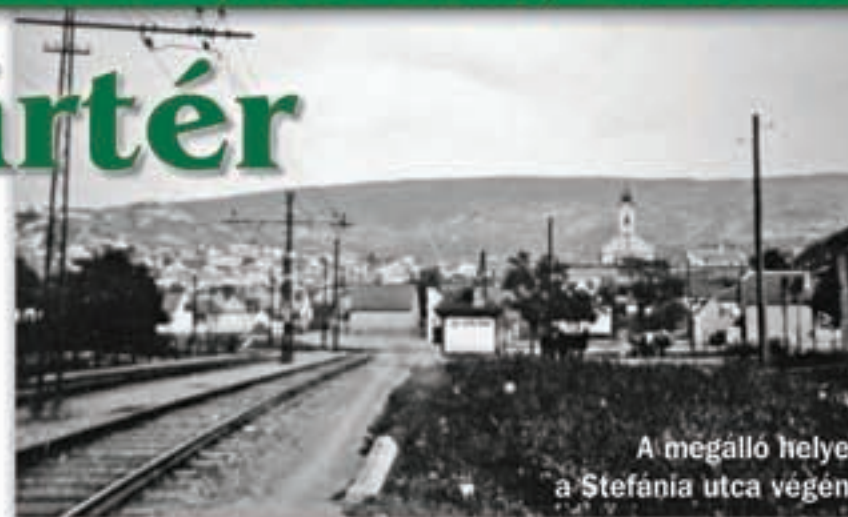
A megálló helye a Stefánia utca végén

Am 23. Juni 1914 wurde jene 13,4 Km lange Nebenstrecke in Betrieb gesetzt, welche vom St.Gellért Platz in Budapest durch Budaörs bis nach Törökbálint verlief. Diese Haltestelle wurde Schafstall, aber auch Levente Straße genannt, in seiner Nähe befindet sich die Zichy Kurie, Mittelpunkt des ehemaligen Wirtschaftsgutes. Heutzutage hat der Verein Budaörser Künstler seinen Sitz in diesem Gebäude.