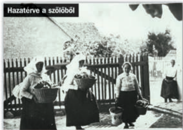
A szövegeket a Bleyer Jakab Helytörténeti Gyűjtemény (Heimatismuseum) munkatársai állították össze. Die Texte wurden von den Mitarbeitern des Jakob Bleyer Heimatismuseums zusammengestellt.

Die Gegend des Törökugrató war in jenen 50 Jahren, in denen die Stadtbahn verkehrte, eine rar bebaute landwirtschaftliche Fläche. Bauern aus Budaörs und Törökbálint hatten hier Weingärten und Pfirsichplantagen. Der Zugang zu ihren Feldern, der Transport der Früchte wurde durch die (optionale) Haltestelle Törökugrató wesentlich erleichtert. Gleichzeitig bestand dadurch – wegen der nahen Eisenbahnhaltestelle in Törökbálint – eine Verbindung mit der Bahnlinie Budapest–Győr–Hegyeshalom.