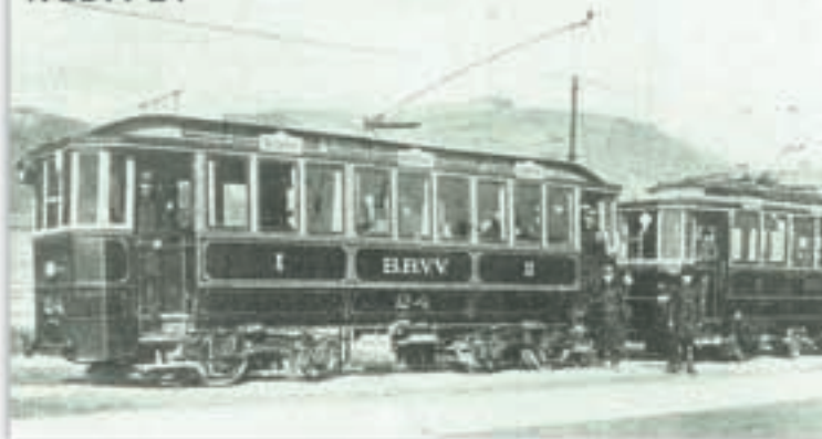
A BBVV 24

Die Entstehung der Stadtbahn – Ursprünglich verkehrte die Stadtbahn im Jahr 1899 zwischen dem St.Gellért Platz in Budapest und Budafok. Erst 1909 verlängerte man die Strecke bis nach Nagytétény, und 1914 baute man sie durch Budaörs bis nach Törökbálint aus. Die dazu nötigen Gebiete hatte man – nach Abmachungen mit den mehreren hundert Grundbesitzern – enteignet. Die Stadtbahn wurde von Arbeitern aus Budaörs und Törökbálint benutzt, die in Budapest arbeiteten, aber auch von Kleinbauern, die ihre Produkte in die Hauptstadt beförderten. Die Stadtbahn fuhr von Budaörs bis zum Gellért Platz etwa 50 Minuten, und war trotz der hohen Fahrpreise sehr beliebt.