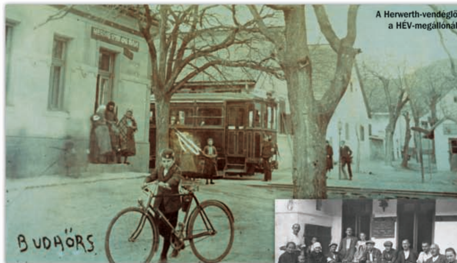
A Herwerth-vendéglő a HÉV-megállónál