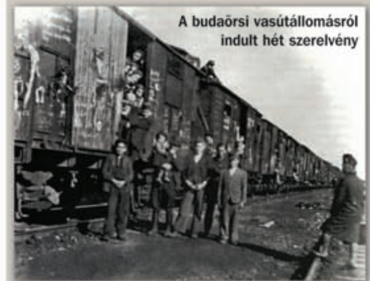
A budaörsi vasútállomásról indult hét szerelvény

Die Vertreibung der Ungarndeutschen begann im Januar 1946 in Budaörs. Von den 10 000 Einwohnern wurden etwa 6000 vertrieben – hinzukommen noch diejenigen, die bereits 1944 von alleine wegingen – so blieben etwa 1000–1500 Ureinwohner daheim. Die ersten Bahnwaggons verließen am 19. Januar 1946 die Budaörser Bahnstation in Richtung Süddeutschland. Im August 1947 kam es erneuert zu Vertreibungen, damals wurden 350-400 Personen ausgesiedelt, aber die Züge fuhrten aus Budafok ab, und diesmal in Richtung Ostdeutschland.