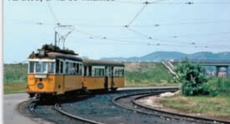
Az utód, a 41-es villamos

Nach dem 2. Weltkrieg, im Mai 1945 wurde der Stadtbahnverkehr zwischen Budaörs und Törökbálint wieder in Betrieb gesetzt, jedoch die Abzweigung in den Kammerwald wurde aufgelöst, denn man brauchte Schienen für Budapest. Im September 1949 ist die Stadtbahn verstaatlicht worden, und 1963 – zum Teil wegen dem Autobahnbau – ist diese Strecke gänzlich eingestellt worden. Ihre Funktion wird nur teilweise von der bis heute bestehenden Straßenbahnlinie Nr.41 ersetzt, die zwischen dem Kammerwald und dem Batthyány Platz in Budapest verkehrt, denn mit Ausnahme des Kammerwaldes bleiben Budaörs und Törökbálint aus dieser Verkehrslinie völlig ausgeschlossen.