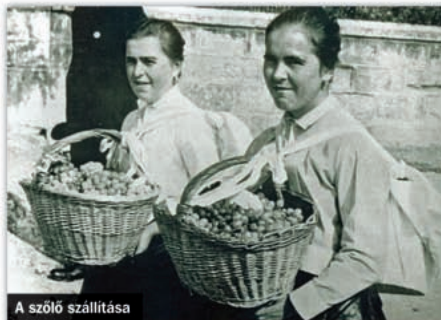
A szőlő szállítása

Die Geschichte des Türkensprungs – Der Türkensprung ist einer der markantesten Berge in Budaörs, er ist 249 Meter hoch. Er wird sowohl in der Fahne als auch im Wappen von Budaörs dargestellt. Im Mittelalter nannte man ihn Sechzig-ochsen Berg, aber auf alten Karten heißt er auch Csiker Berg. Er ist der südlichste Gipfel der Budaer Berge, der von der Bergkette durch einen tiefen, steilen Bruch abgespalten ist. Der Signalturm auf der Spitze des Türkensprungs gab Zeichen für Flugzeuge, die auf dem Budaörser Flugplatz landeten.