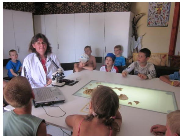
AZ ÚJ LABORATÓRIUMUNK