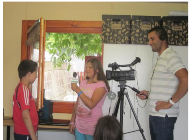
Médiatábor – a Budaörsi Rádió és Minálunk.hu látogatásai