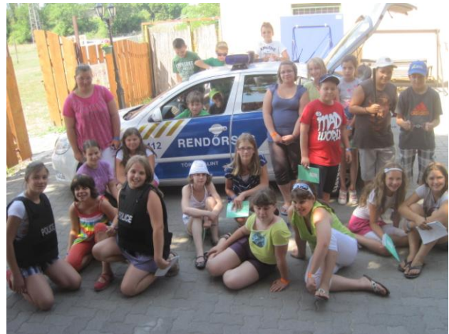
C.S.I. Budaörs - krimitábor