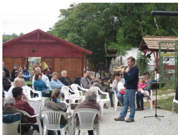
Budaörsi Baptista Gyülekezet, családi nap