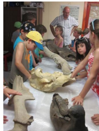
A Magyar Természettudományi Múzeum őslénytani bemutatója