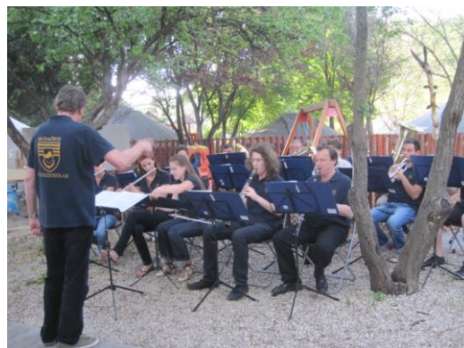
Budaörs-Bretzfeld testvérvárosi találkozó – Május 6.