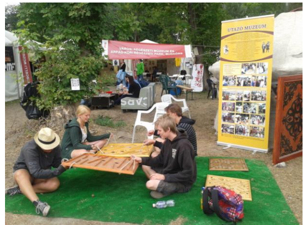
Sziget Fesztivál, Múzeumsziget