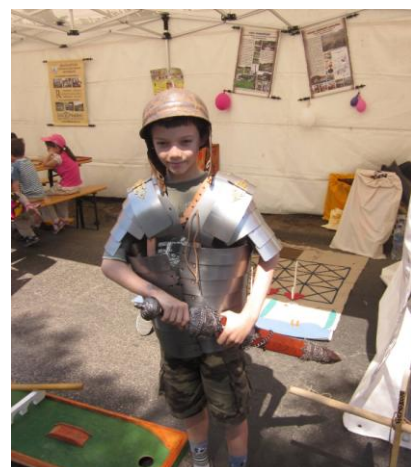
Budaörsi Fesztivál, játszóház a Szabadság úton