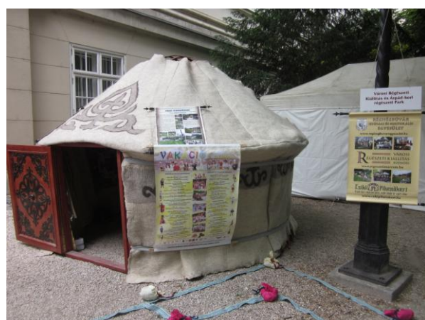
Múzeumok Majálisa, Magyar Nemzeti Múzeum kertjében