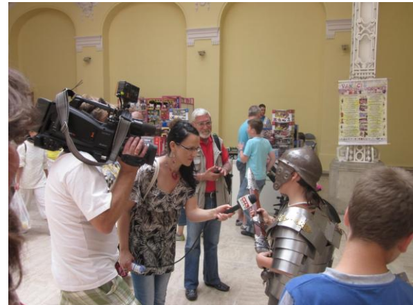
Vajdahunyad vár, Játék Kiállítás