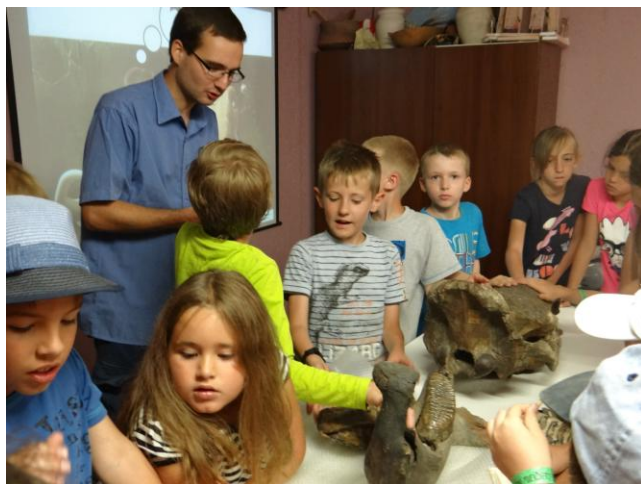
A Magyar Természettudományi Múzeum őslénytani bemutatója