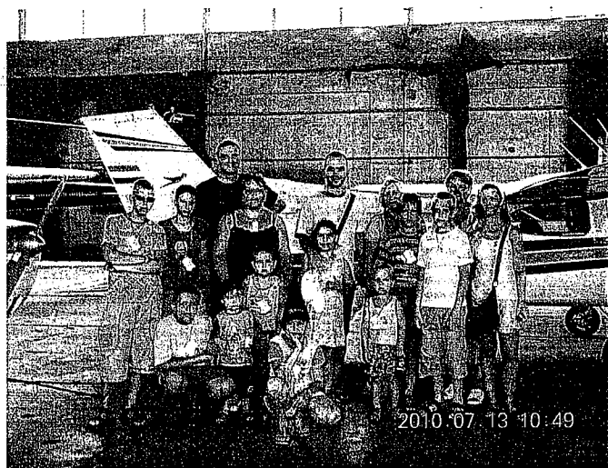
„Generációk Találkozója” – budaörsi reptér

Megtekintettük a budaörsi repteret is, ahol megismerkedhettünk a repülőgépekkel, illetve a reptér történetével.