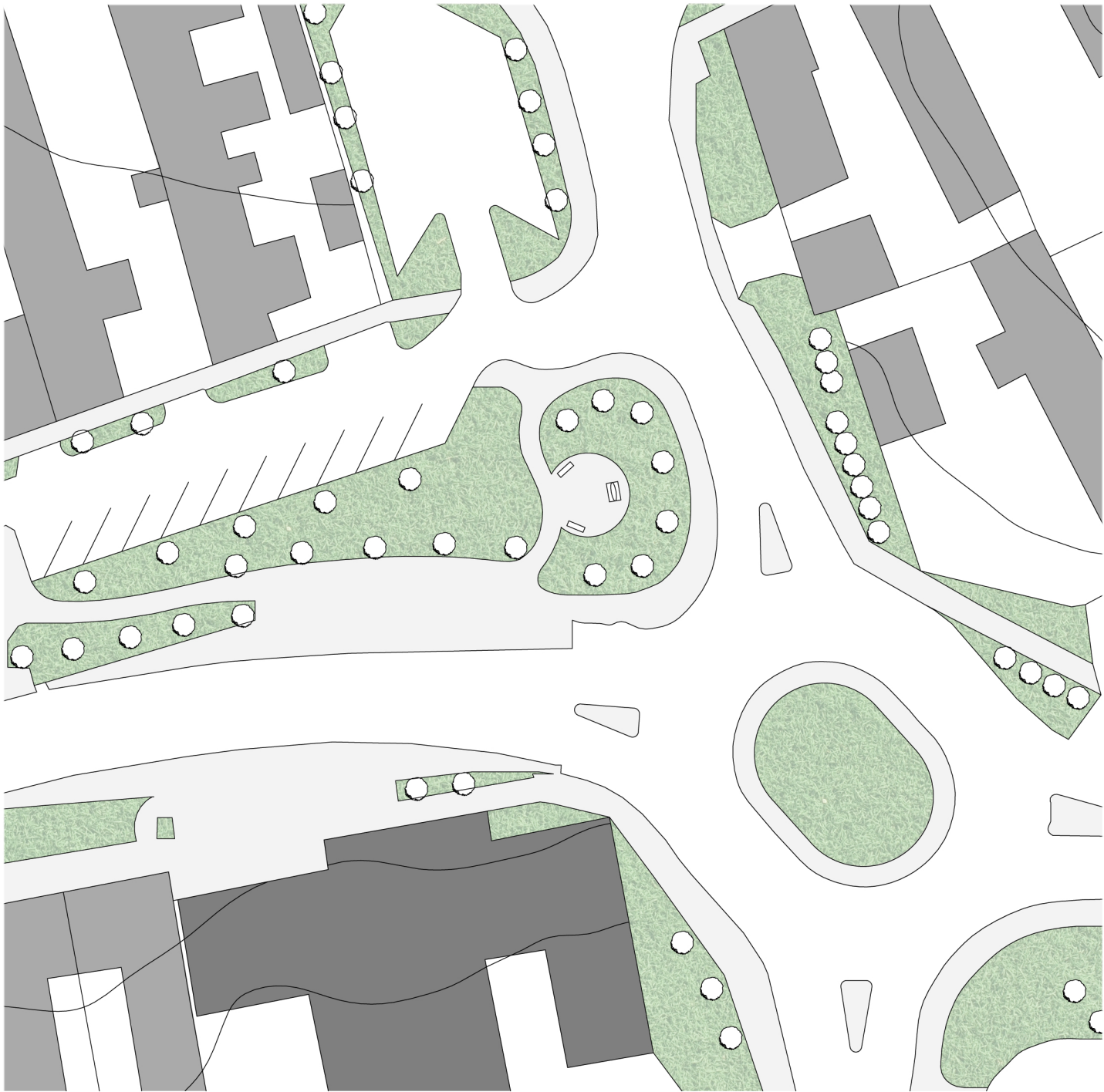
HELYSZÍNRAJZ M = 1:500