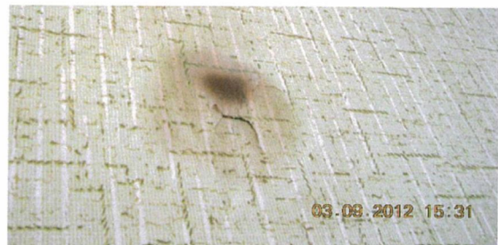
elektromos égési nyom a kötődobozban