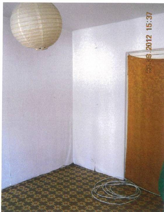
szoba (12,55 m2)