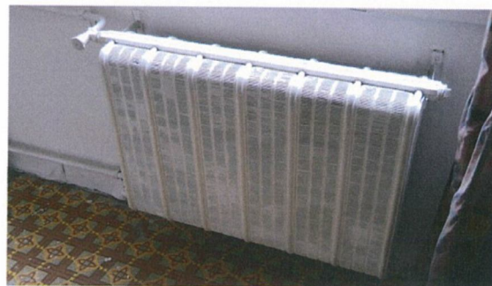
mázolt RADAL alumínium radiátor