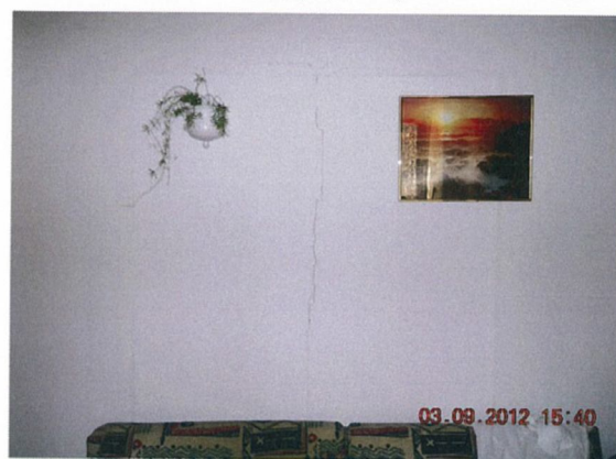
szobák közti gipszkartonozott kétszárnyú ajtó helye