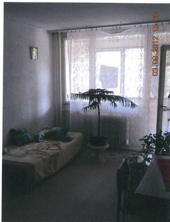
szoba (17,37 m2)