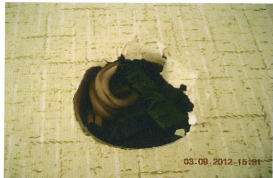
elavult alumínium elektromos vezetékek