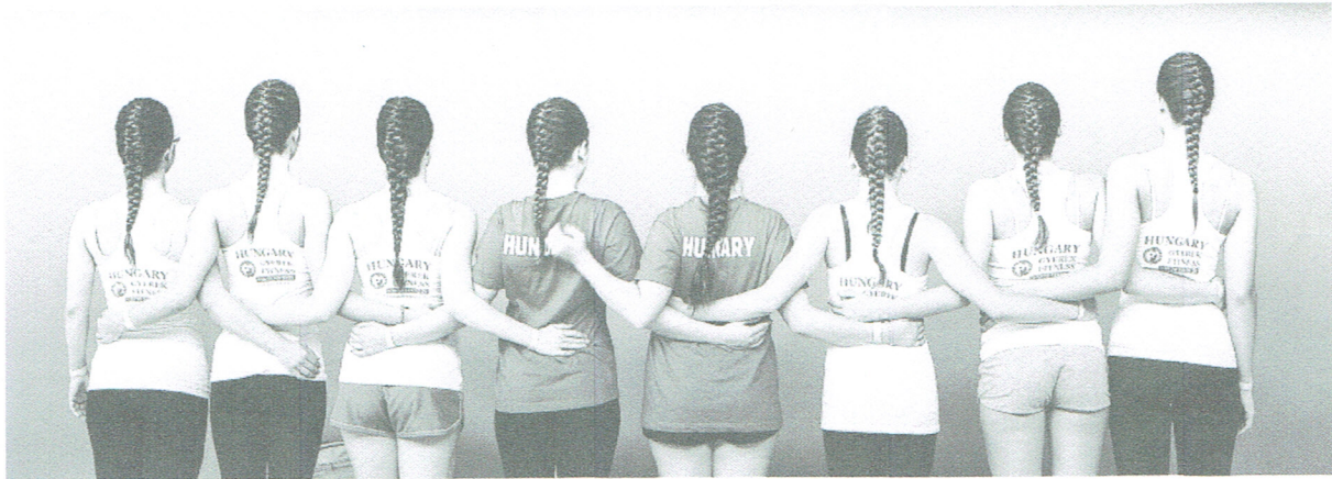
IDF Világ bajnokság II. hely 2014.05.20.

Jelenleg 150 fő gyermek, diák és 40 fő nyugdíjas tagunk van. Programunkban-elsősorban Budaörsiek - gyerekfitness tánc és időstorna foglalkozásokon vesznek részt. Heti 2-5 illetve a nyugdíjasok 2 alkalommal létszámunk 190 fő/hét.