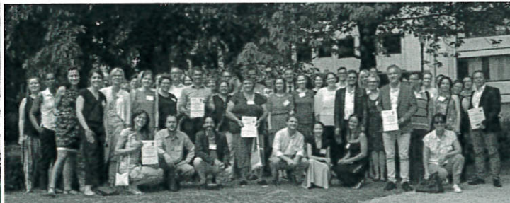
A Spórolunk@kiloWattal magyar nyertesei, valamint a nemzetközi nyertes települések képviselői a brüsszeli díjátadón.