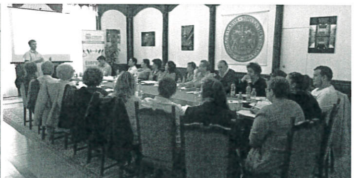
Rendezvények és képzések a résztvevő önkormányzatok számára