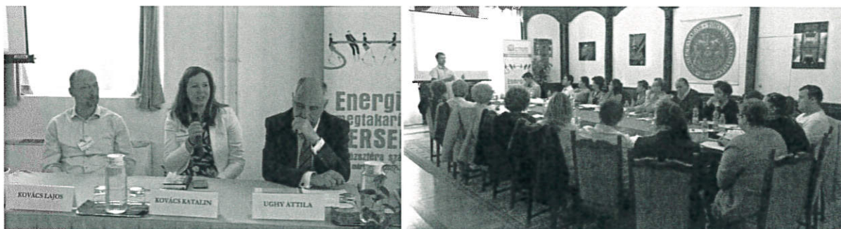
Rendezvények és képzések a résztvevő önkormányzatok számára

A COMPETE4SECAP projekt célja egyrészt, hogy segítséget nyújtson a résztvevő önkormányzatok számára a Fenntartható Energia Akciótervek (SEAP) gyakorlati kibontására és kiegészítésére a klímaakciótervvel, másrészt pedig a „Spórolunk@kiloWattal” projekthez hasonlóan, hogy a közsféra dolgozói energiatudatosabban éljenek viselkedésük/szokásaik megváltoztatásával csökkenthessék munkahelyi energiafelhasználásukat.