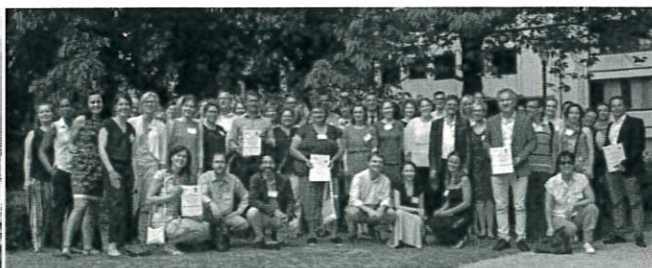
A Spórolunk@kiloWattal magyar nyertes, valamint a nemzetközi nyertes települések képviselői a brüsszeli díjátadón.