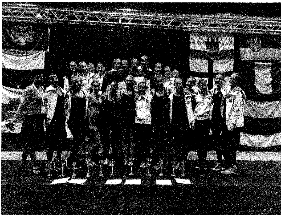
(2017. IDF Világbajnokság Bajnokság )

Egyesületünk 2008-ban alakult, jelenleg 210 tagunk van 4-18 éves fiatalok aki budaörsi lakosok. A működésünk a gyerekfitness és modern tánc. Az akrobatika Rg gimnasztika elemekre épülő oktatási rendszerünk a fiatalok életkori sajátosságainak figyelembevételével épül fel az óvodásoktól indulva 22 éves korig. Az edzés módszerek mellett életmód, étkezés tanács adással készítjük fel az életre tanítványainkat. Gyermek tagjaink heti 2-5 edzésen vesznek részt. Csoportjaink helyszínei: Budaörs Mindszenty Általános Iskola, ABS Sport Centrum, Baross utcai Sportterem.