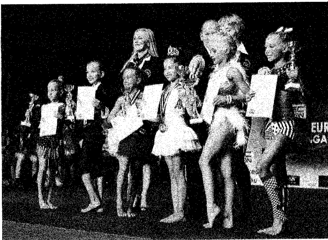
2017 IFBB Európa Bajnokság

Jelenleg 210 fő gyermek és diák tagunk van . Programunkban-elsősorban Budaörsiek - gyerekfitness és tánc foglalkozásokon vesznek részt. Heti 2-5 illetve létszámunk 210 fő/hét. Az alábbi helyszíneken vannak csoportjaink: