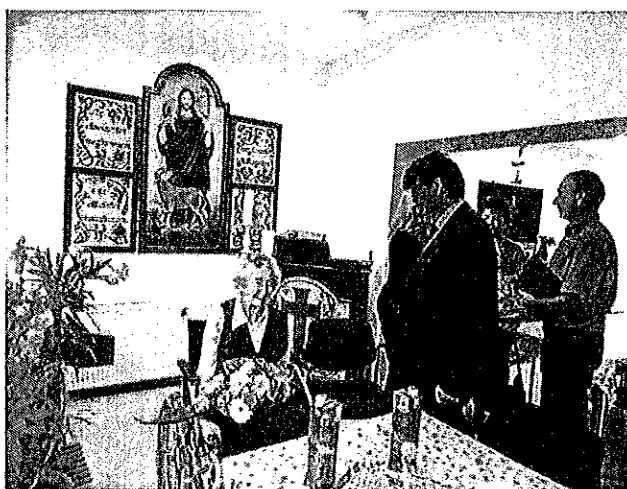
(Szépkorú lakó köszöntése)

Szépkorú lakónkat köszöntötte Polgármester Úr, Jegyző úr és a szociális iroda vezetője születésnapja alkalmából.