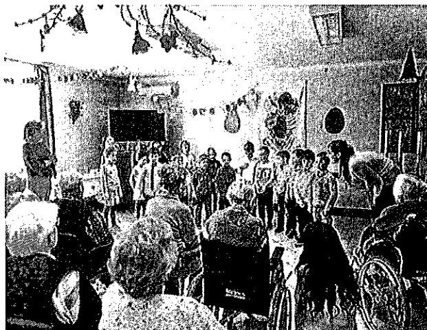
(Kamaraerdei Óvodások húsvéti műsora)

A kamaraerdei óvodások húsvéti műsorát tekinthették meg lakóink, a végén a kis fiúk meglocsolták a néniket. Nagyon jó hangulatú műsor volt.