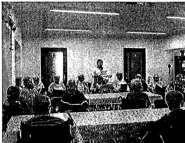
(Megemlékezés 1956. október 23-ról)

Megemlékeztünk az 1956. október 23-i forradalom és szabadságharcról. Időseink versekkel készültek a többi lakónak.