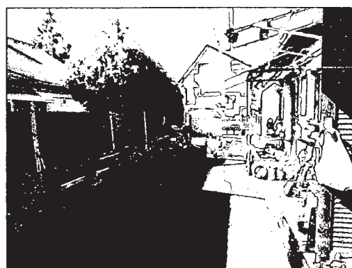
3850/1 hrsz oldalkert