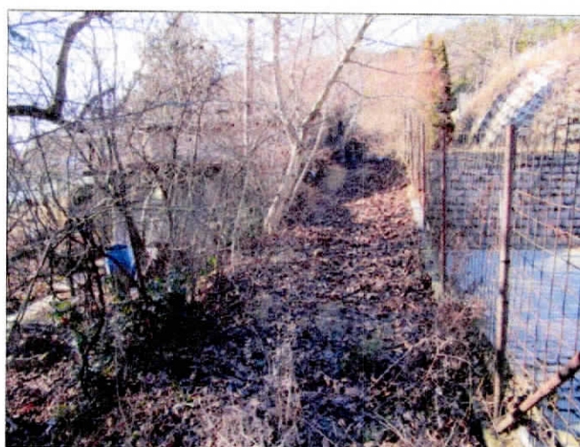
11310 hrsz közterület