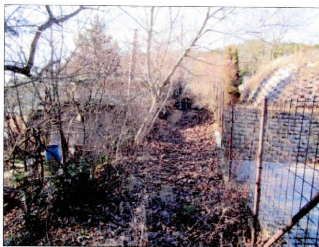
11310 hrsz közterület