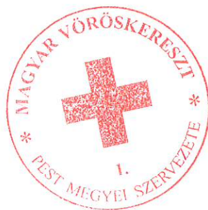
Dienes Rita megyei igazgató