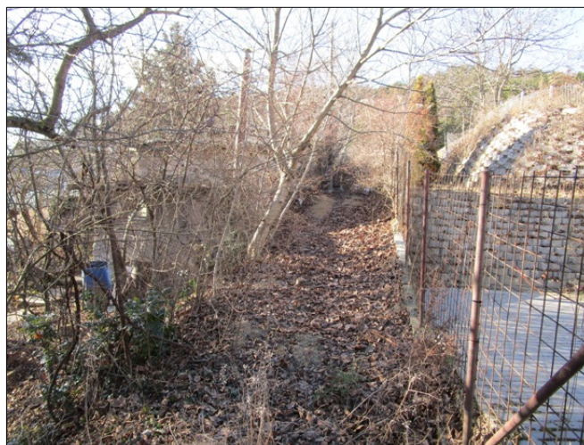
11310 hrsz közterület