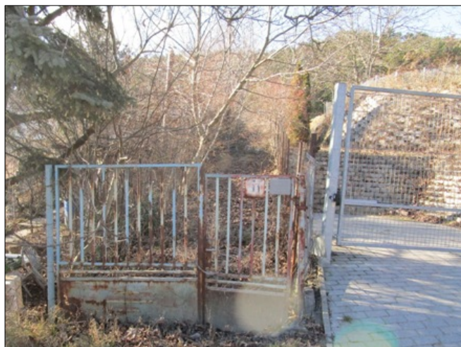
11310 hrsz közterület