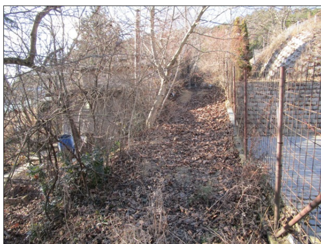
11310 hrsz közterület