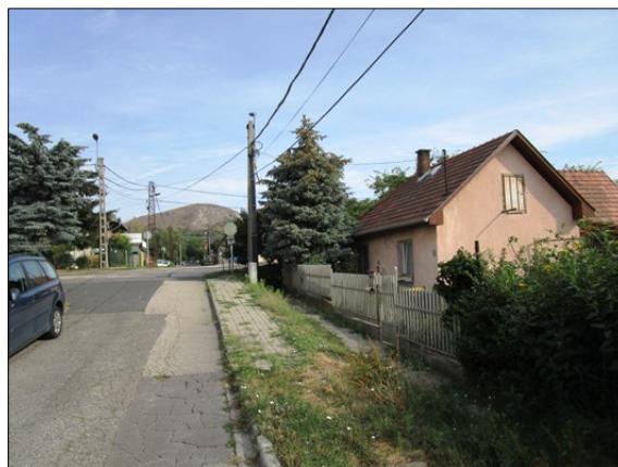
Utcakép, Komáromi u.