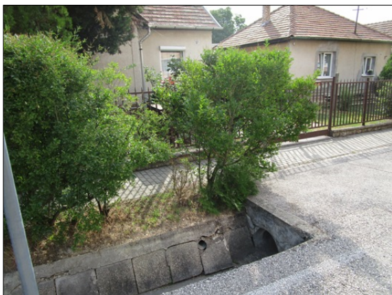
Nyitott vízvezető árok