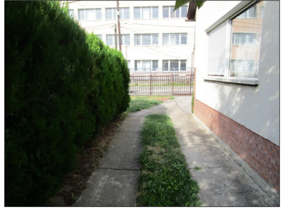
Oldalkert, gépkocsi keréknyom