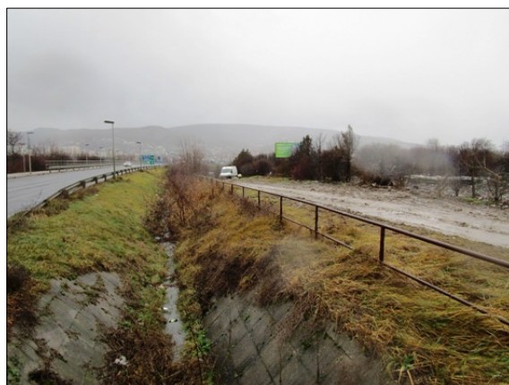
095/80 hrsz közterület