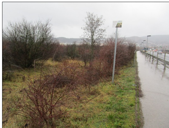
095/76 hrsz közterület