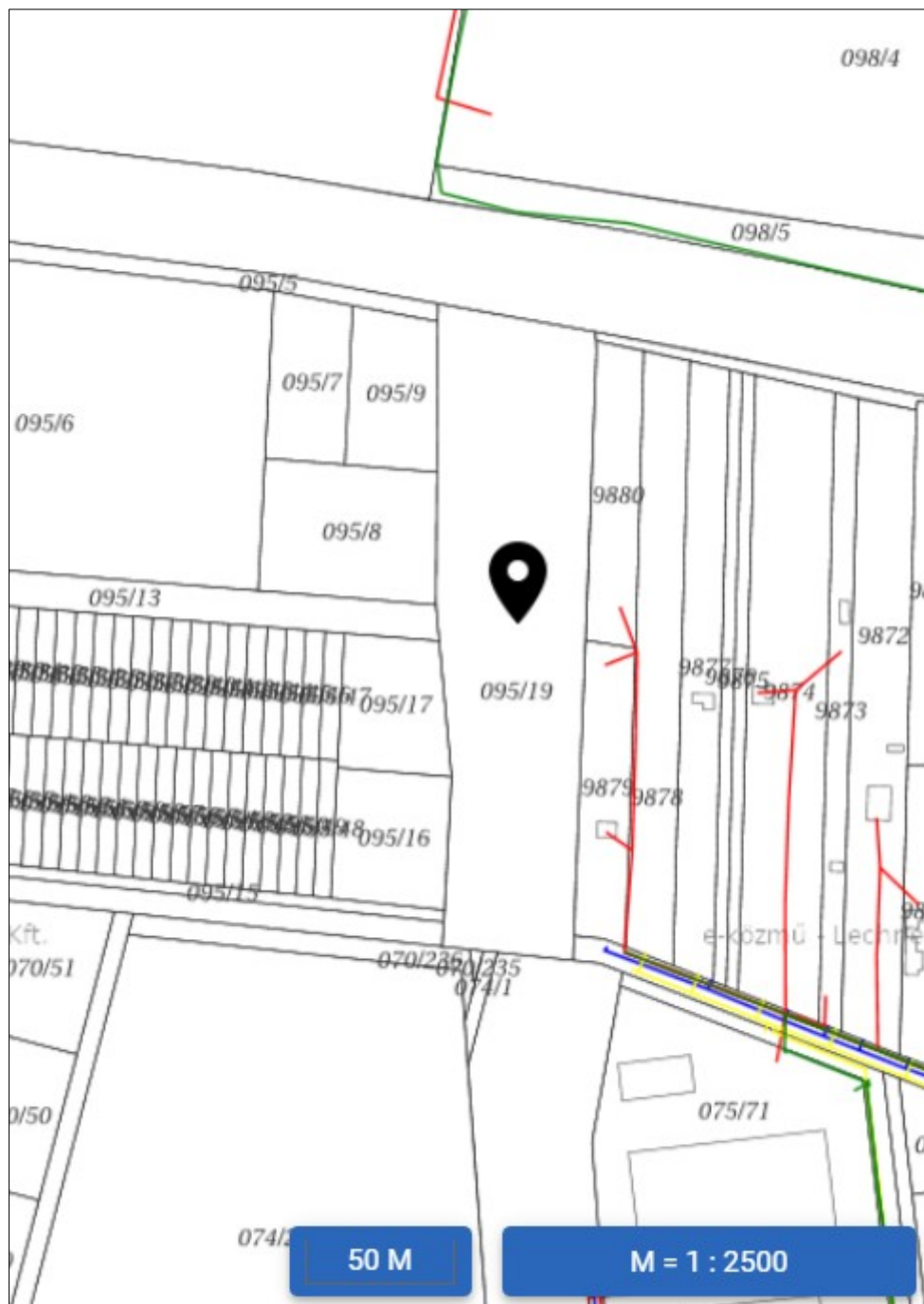
E-közmű térkép 095/19 hrsz