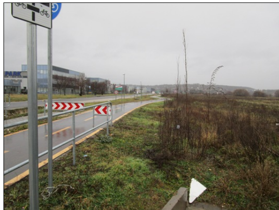
Utcakép, Budapest-Balaton kerékpáros útvonal