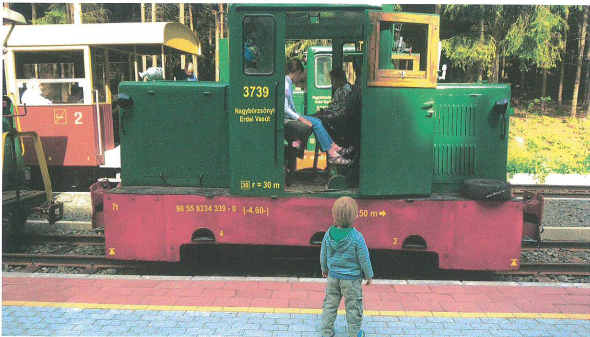
A nagybörzsönyi kisvasút vonzásában, 2016.

A közös programok, kirándulások, a tábori élet mindig összekovácsolják a közösséget, elmélyítik a barátságokat.