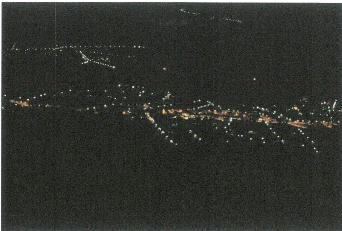
Éjszakai (2011-ben) és nappali túra (2012-ben) ugyanazon helyszínen, Szilvásvár.