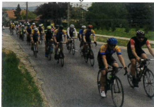
Budaörsről indulva útbán Bajnára

Nem mehettünk el szótlánul az eddigi legnagyobb hazánkban rendezett kerékpáros eseménye, a Giro 'd Itália mellett, közösségi kitekerést és szurkolói zónát szerveztünk Bajnára, hogy közösen szurkoljunk a mezőnynek. Ezen a rendezvényen csaknem 50-en vettünk részt, örök élményt szerezve a résztvevőknek és magunknak.