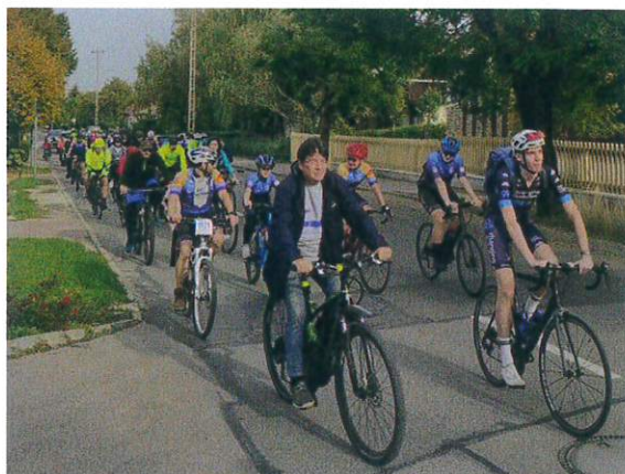
Úton a Farkasréti úton

A Budaörsi Rendőrkapitányság és a Közterület-felügyelet munkatársainak köszönjük szépen a kísérést és útvonal biztosítást.