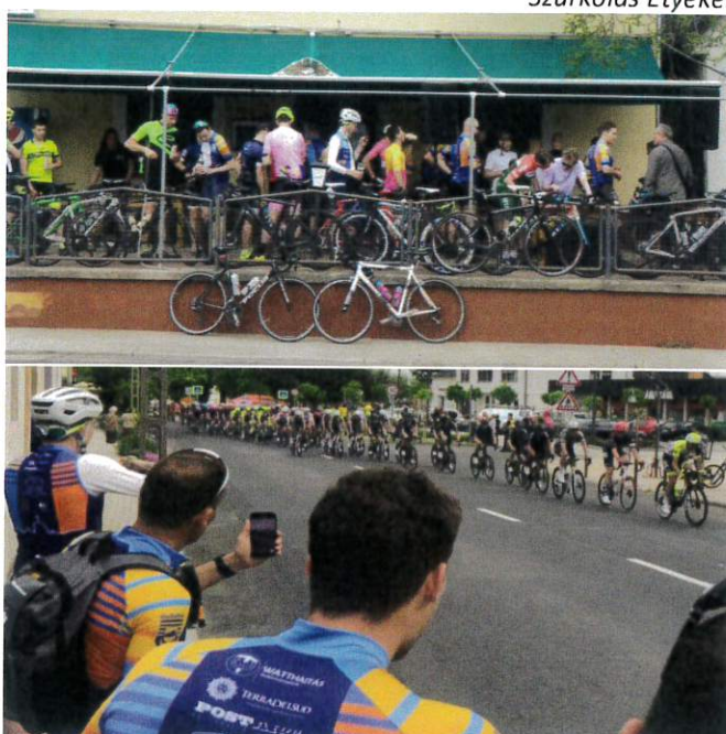
Szurkolói zóna egy része Bajnán, ahol a Giro 'd Itália mezőnye elhaladt