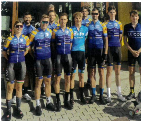
A fillaris szervező csapat

A Tor de Zalakaros szervezői részéről felkérést kaptunk a verseny előtti hetekben egy pályabejárás megszervezésére. A nagyobb itthoni sportegyesületeket személyesen meghívtuk, számukra szállást szerveztünk Zalakaroson, majd közel 60 fő részvételével letekertük a 140 km-es távot. A Fillari edzőtáborában már rendszeresített háziversenyt, miszerint a kijelölt 3 hegyhajrá első 3 helyezettjét összesítjük, itt is megvalósítottuk.