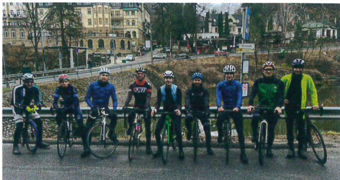
Lillafüreden a Fillari Team

A Fillari Team 2022-ben két alkalommal volt edzőtáborozni . Márciusban a Börzsönyben töltött egy hosszúhétvégét, majd áprilisban a Bükki-hegységbe látogattunk egy szintén hasonló hosszúságú edzőtáborba. A sportértéke mellett rendkívül jó közösségépítő ereje volt ennek a két eseménynek, mely megalapozta a sikeres évet.