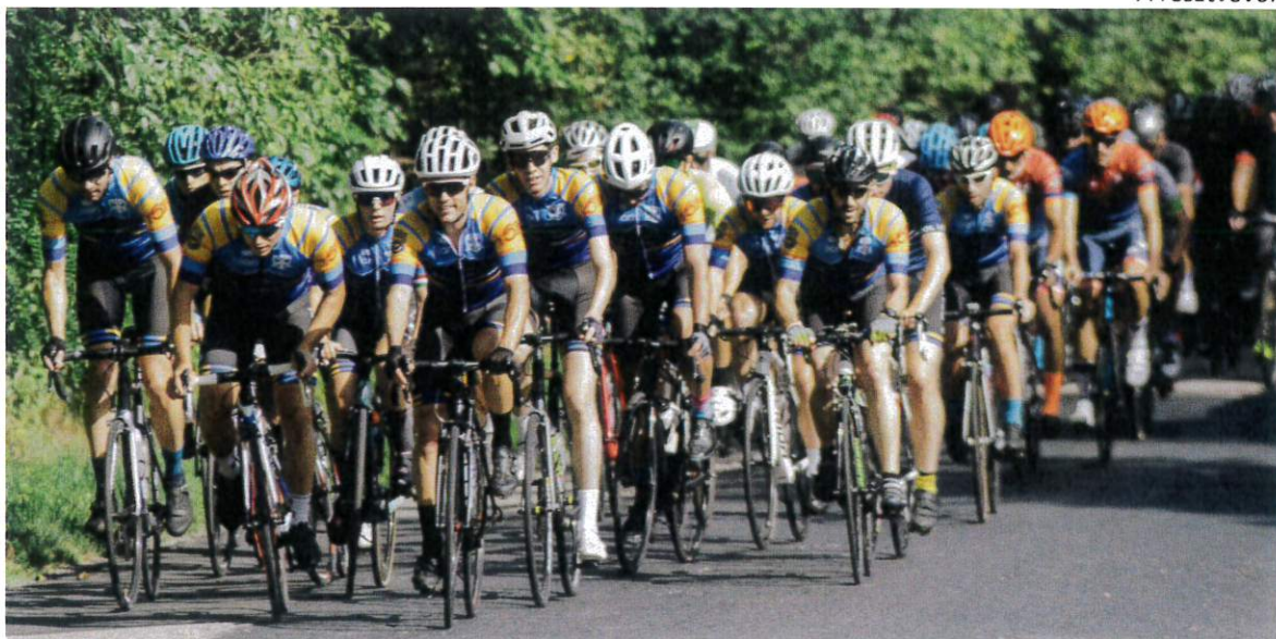
A fillaris csapat vezetésével érkező mezőny