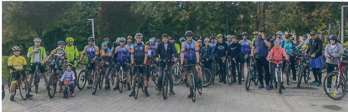
Indulás a Budaörsi Polgármesteri Hivatal parkolójából

Fillari Team Budaörs Kerékpáros Sportegyesület 2040 Budaörs, Bárány u. 16. Adószám: 18711530-1-13