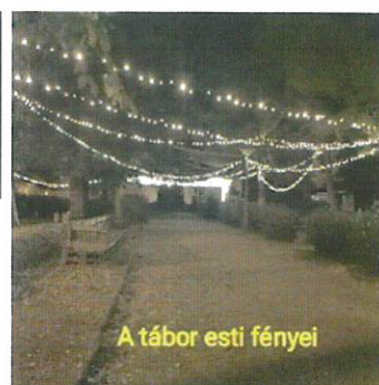
A tábor esti fényei