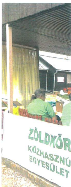
Kézműves foglalkozások, színezések, kártyapartik, minden nap voltak