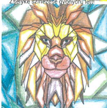
Zselyke színezése gyönyörű lett!