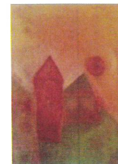
Ilyés Márta: Naplemente