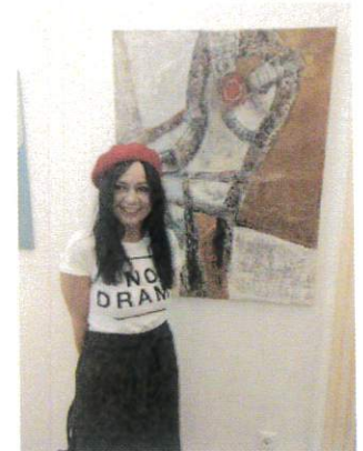
Hollai Krisztina-archív - HAON - „A kép véglegesen csak akkor készül el, amikor a néző elé kerül”

Forrás: HAON - „A kép véglegesen csak akkor készül el, amikor a néző elé kerül”