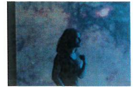
Sánta Kristóf | Mysite (kollektivzenemuhely.com)