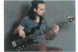
Sánta Kristóf | Mysite (kollektivzenemuhely.com)

Forrás: Sánta Kristóf | Mysite (kollektivzenemuhely.com)