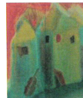
Ilyés Márta: Házak hegedűvel