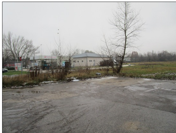
Környezet: benzinkút, autómosó