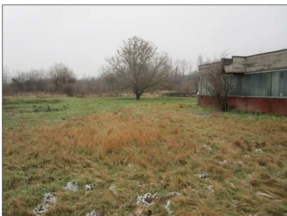
A 091/23 hrsz területe