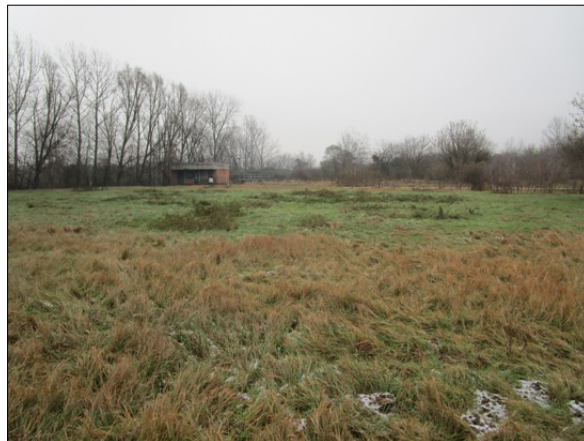
A 091/23 hrsz területe