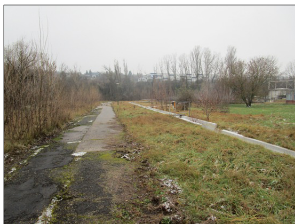
Aszfalt út, árok