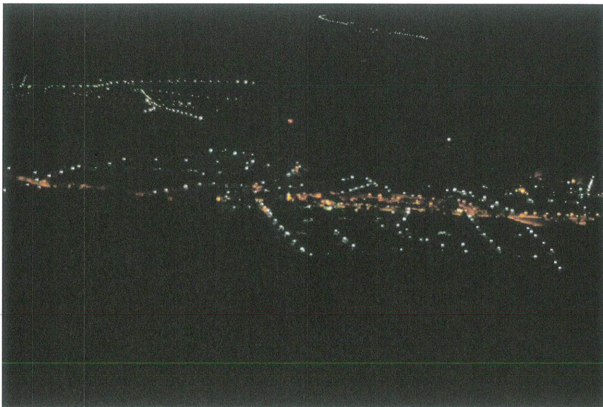
Éjszakai (2011-ben) és nappali túra (2012-ben) ugyanazon helyszínen, Szilvásvárad.