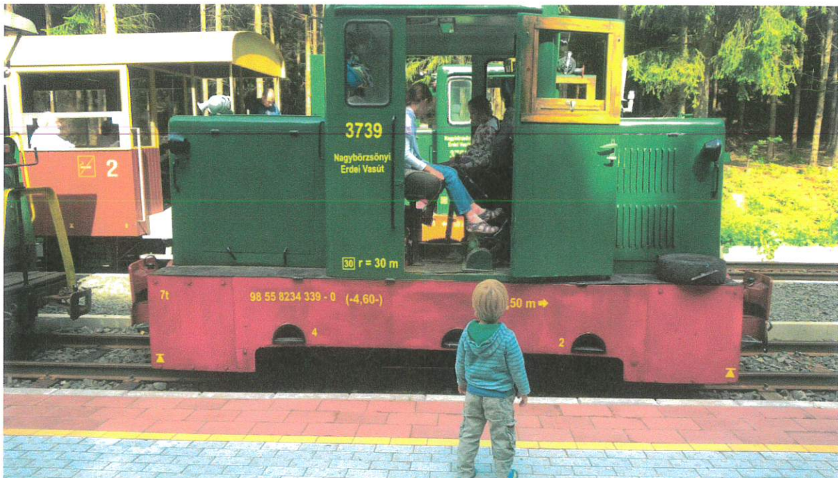
A nagybörzsönyi kisvasút vonzásában, 2016.

A közös programok, kirándulások, a tábori élet mindig összekovácsolják a közösséget, elmélyítik a barátságokat.