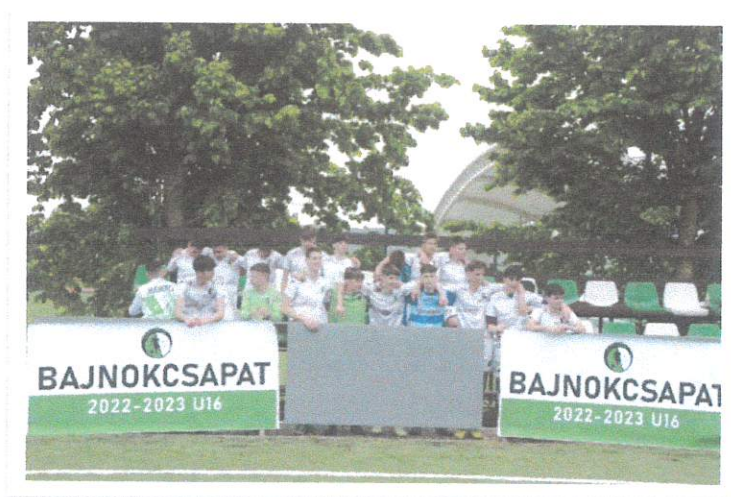
Bajnok az u16-os csapatunk!

Mi, Budaörsön dolgozó szakemberek hiszünk benne, hogy az életkornak megfelelően több irányból is megközelíthetők a sikerek. A sportági iránti elkötelezettség és szeretet, a játék öröme biztos alapot jelentenek a későbbi teljesítménynek. A stabil technikai és taktikai bázis megteremtését követően, a tehetséggondozáson és a kreatív játékon alapuló egyéni teljesítményen túl, célunk a mérkőzésérettység és a megfelelő mentális stabilitás kialakítása, hogy a korosztályos képzést végigjárva, játékosaink, akár Budaörsön, profi labdarúgóvá válhassanak. Ennek ékes bizonyítéka, hogy a 2022/2023-as szezonban u16-os csapatunk megnyerte a bajnokságát, u19-es csapatunk pedig ezüstérmes lett..