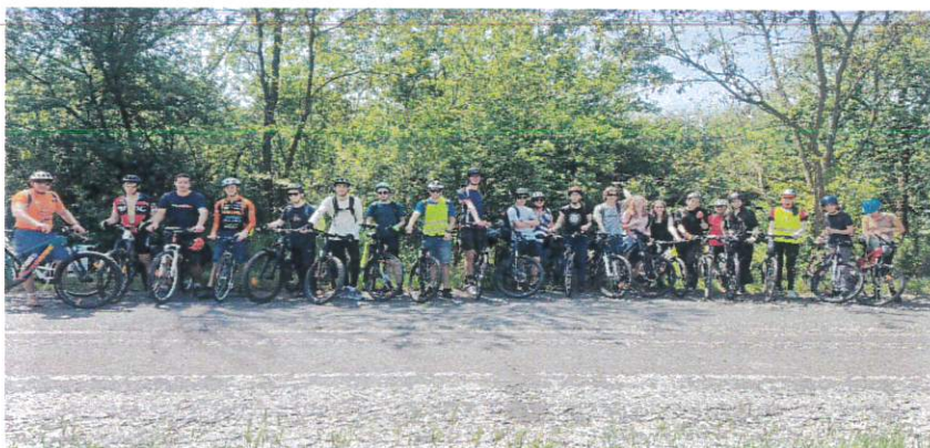
2023. június vége: 5 napos zempléni vándortábor