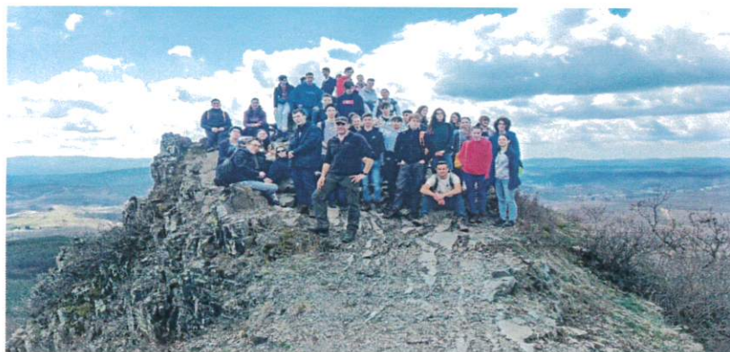
2023. 05.20. – BuBa kerékpárút Budaörs-Etyek szakasza