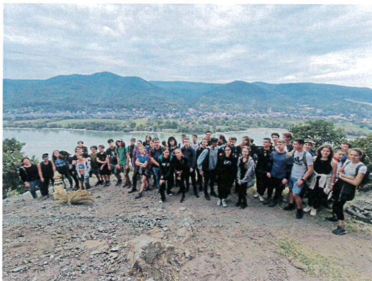
2023. október 14. – Budaörsi Kopárok