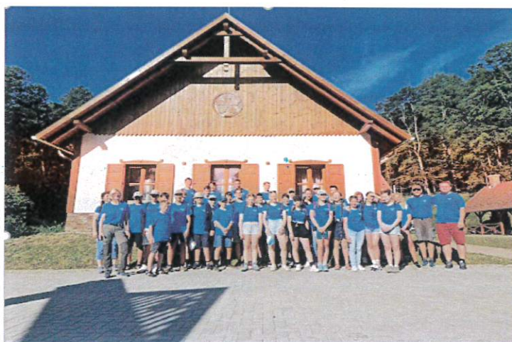
2023.szeptember 30. – Börzsöny