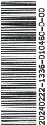
Számla összesítő önkormányzati támogatás elszámolásához

Szerződés száma: ÖNK-Sz 2023-291 Önkormányzati támogatás összege: 450.000 Támogatott időszak bevételei összesen: 3.605.596 Saját források összege: 3.155.596