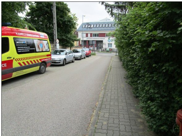
Kereszt u. utcakép