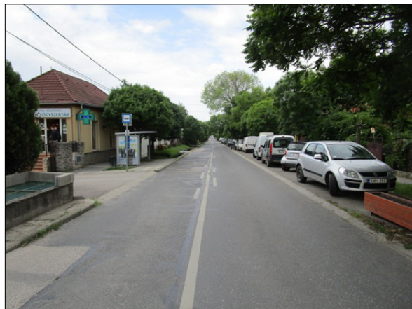
Kossuth Lajos u. utcakép