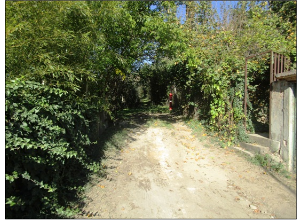
Utcakép, Tűzkőhegyi u.