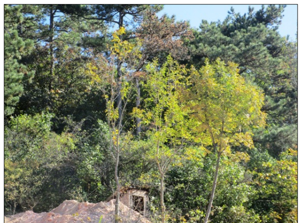
A 9731/2 hrsz terület