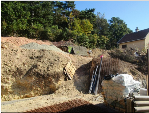
A 9731/1 hrsz utcai bejárata