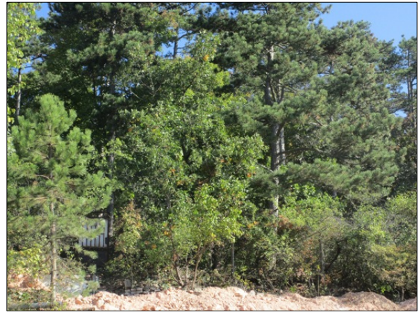
A 9731/1 hrsz és a 9731/2 hrsz határa