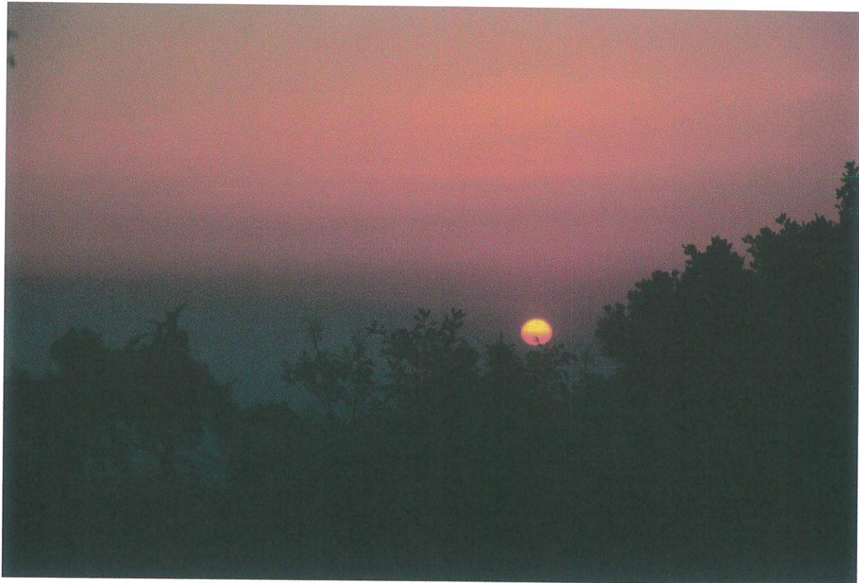
Napfelkelte, Szilvásvár 2012.

A közös programok, kirándulások, a tábori élet mindig összekovácsolják a közösséget, elmélyítik a barátságokat.