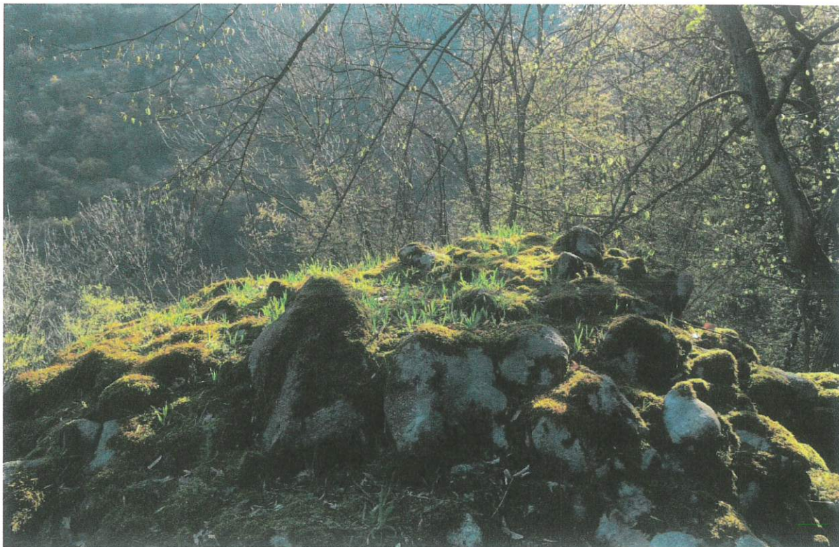
Kirándulás, Nagybörzsöny, 2024.