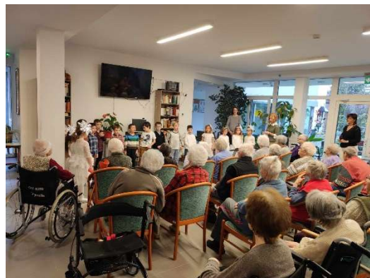
Kamaraerdei Óvodások Műsora