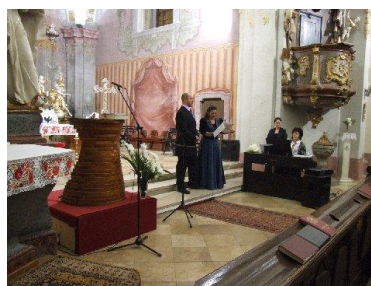
Erkel Ferenc Emlékhangverseny a Római Katolikus Templomban