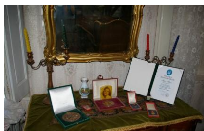
Mezei Mária Emlékház