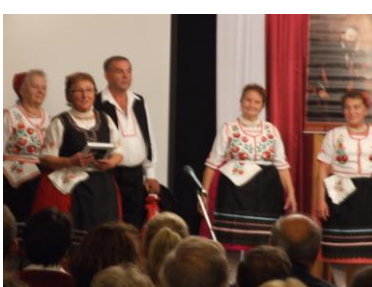
Ofella Sándor Hagyományörző Néptánc együttes