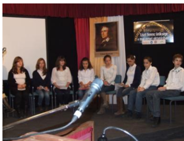
Városmajori Ének-zene Általános Isk. és Gimnázium tanulói