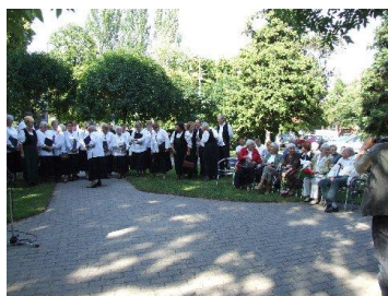
Koszorúzás, megemlékezés az Erkel szobornál