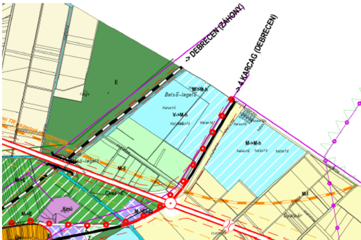
A hatályos településszerkezeti terv részlete