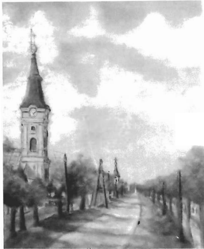
Fő utca az Evangélikus templommal