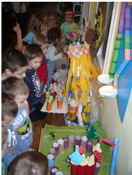
„Európai hulladékcsökkentési hét”