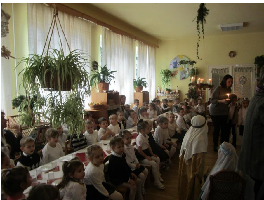
Bábozás az óvodában