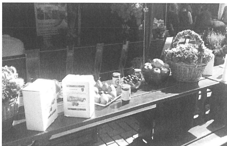
Békéscsaba, Megyei Közfoglalkoztatási Kiállítás