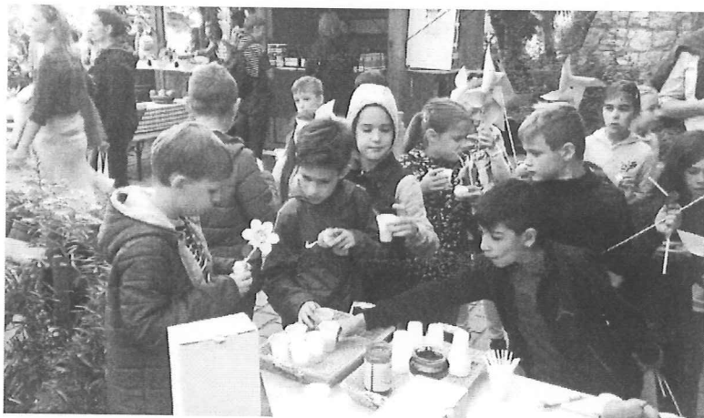
Budapest, Országos Közfoglalkoztatás Kiállítás