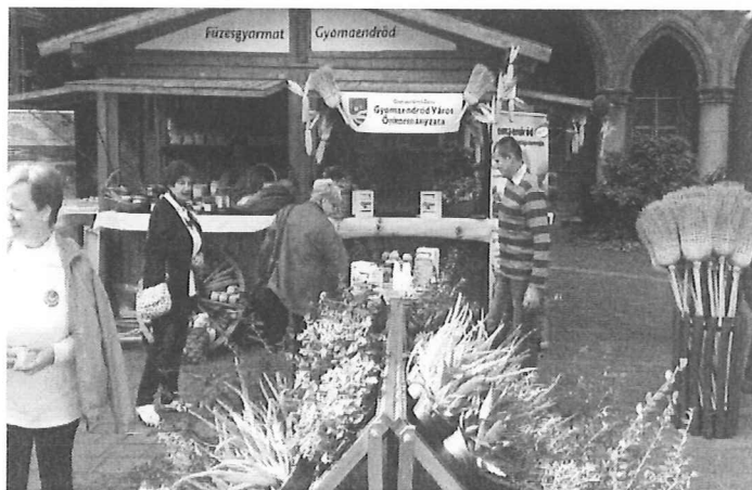
Budapest, Országos Közfoglalkoztatási Kiállítás

Ezek a fesztiválok, rendezvények rengeteg érdeklődő találkozhatott a homoktövisből készített készítményekkel, kóstolhatta, megvásárolhatta azokat. De megtekinthették a kertészetben előállított virágokat, vagy az asztalosipari termékeket, seprűket, illetve szórólapok segítségével standunk népszerűsítette városunkat.