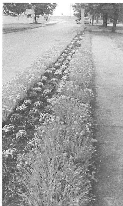
pünkösdi szegfű, árvácska

legnagyobb fóliasátrunkat is egy jól működő, fűtési rendszerrel tudtunk ellátni. A fűtési rendszer korszerűsítését teljes egészében a közfoglalkoztatás költségvetése finanszírozta. A korszerűsítés óta szinte problémamentes, gazdaságos a kertészet fűtése.