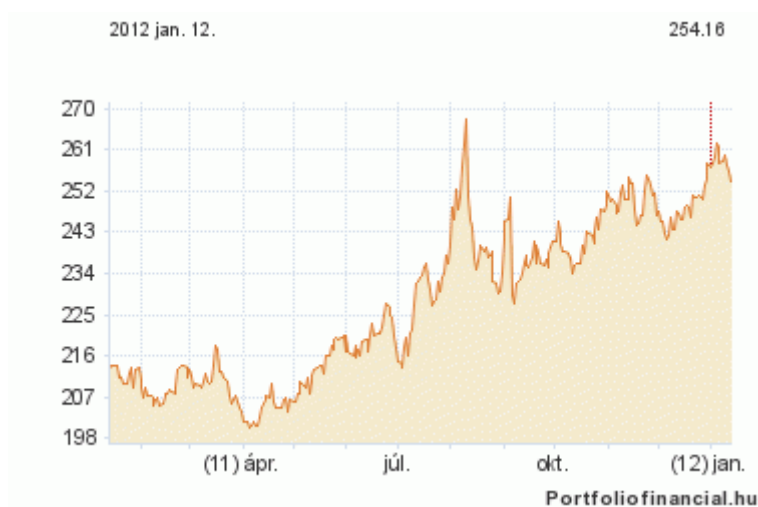
EUR/HUF 2011 Q3