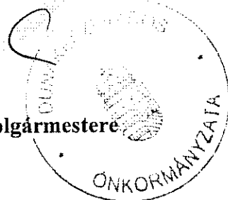
Dióssi Csaba Dunakeszi Város Polgármestere