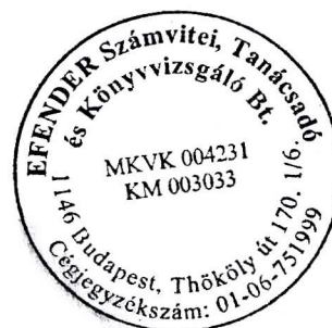
Flender Éva kamarai tag könyvvizsgáló (006535)