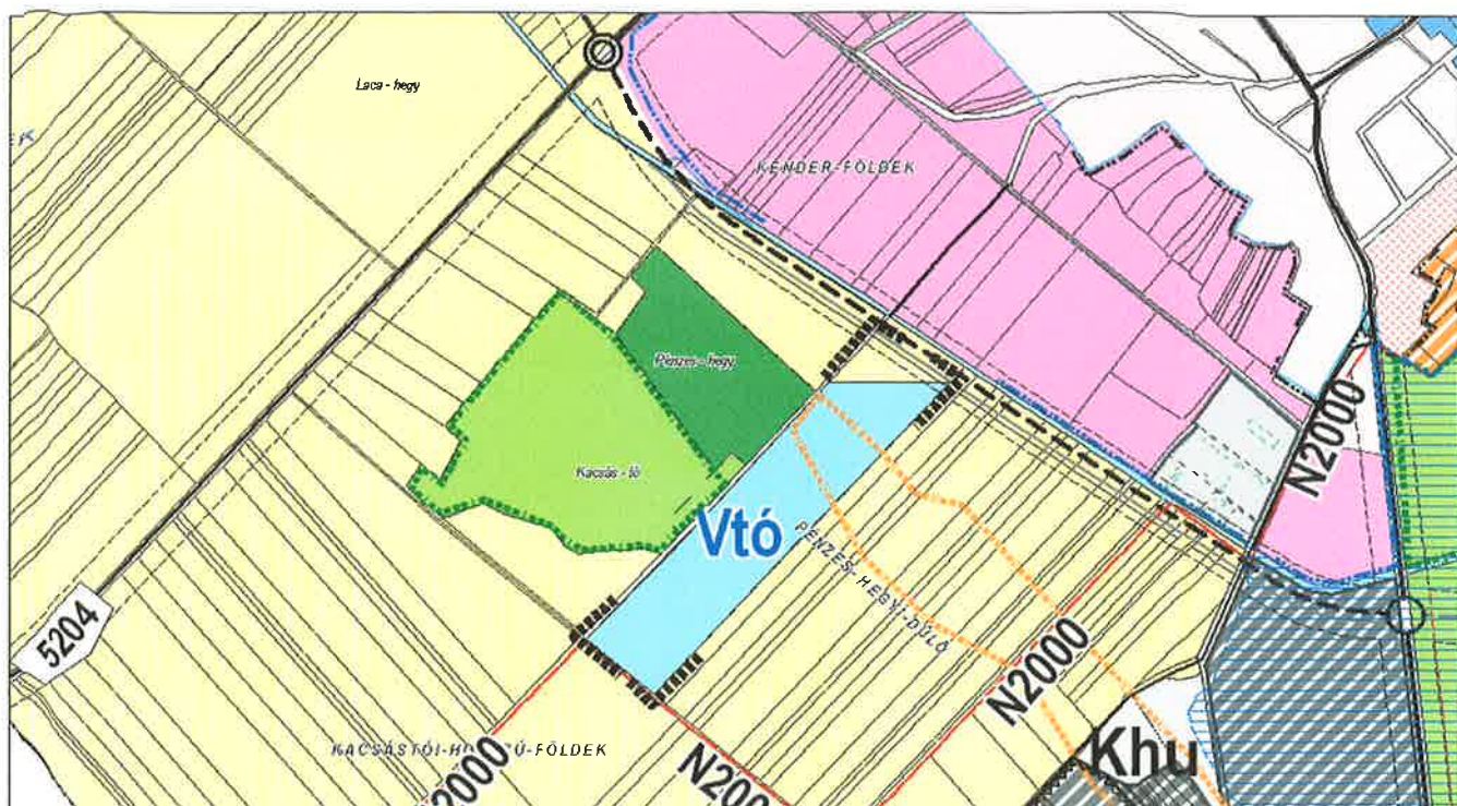
A hatályos Településszerkezeti terv a módosítással érintett terület jelölésével