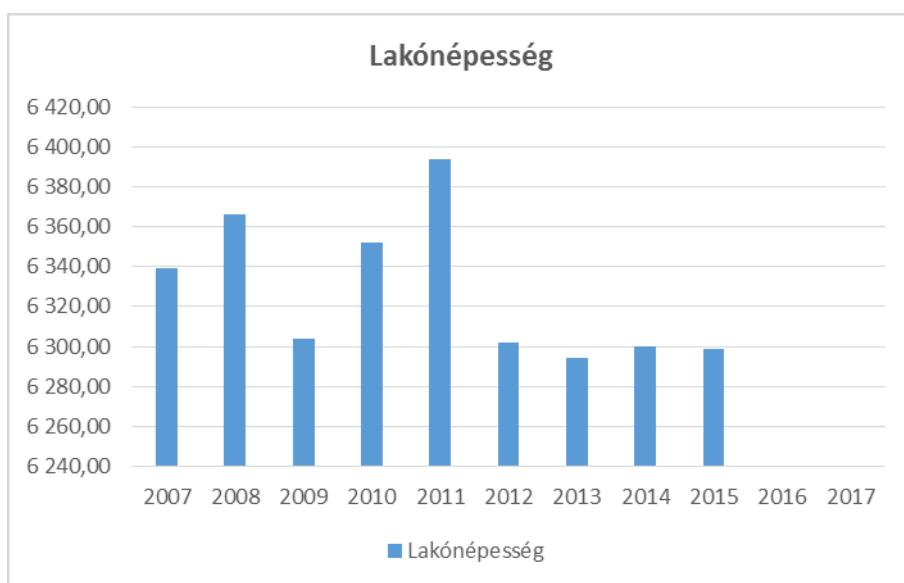
3.1.3. számú táblázat

Az alábbi táblázatok frissítésre kerültek: