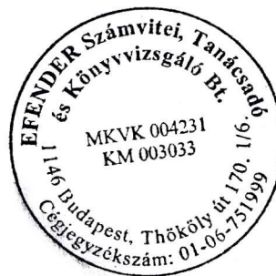
Flender Éva kamarai tag könyvvizsgáló (006535)